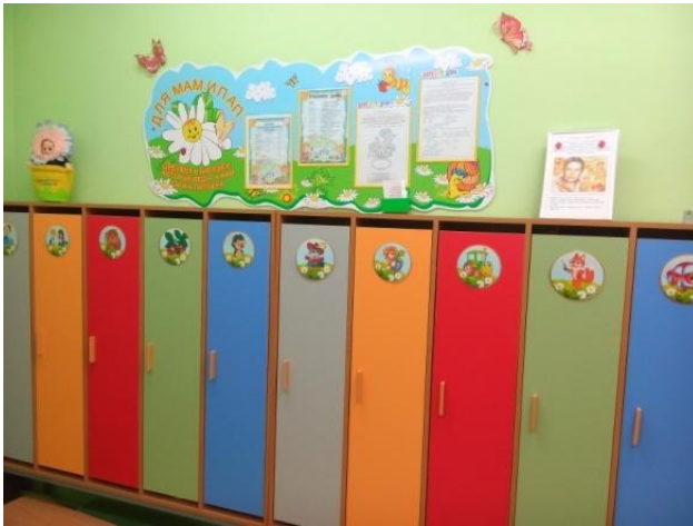
Детская стенка для игр